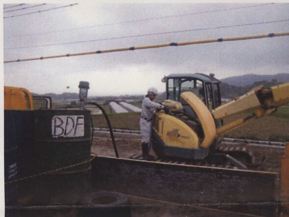
バックホー給油状況