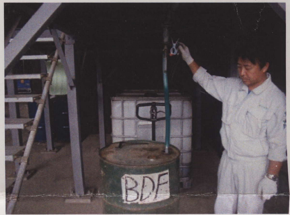
BDF プラント～ドラム缶流込み状況