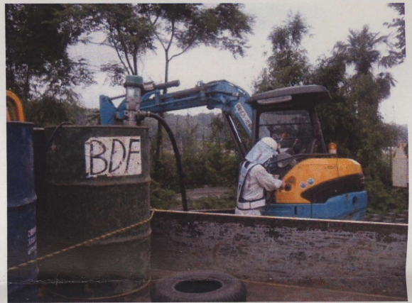
バックホー給油状況